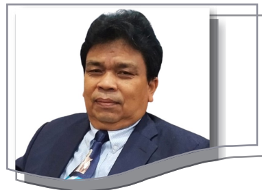
Ketua STT KADESI Yogyakarta

Shalom saudara yang terkasih dalam Tuhan Yesus Kristus.